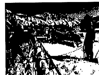
命綱固定アンカーの使用例